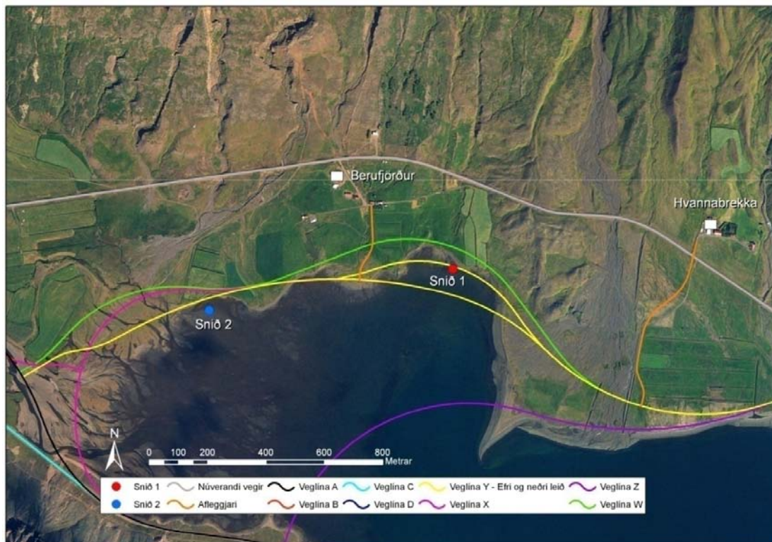
Mynd 1. Staðsetning sniða á leirum í Berufirði ásamt fyrirhuguðum veglínunum í botni Berufjarðar.